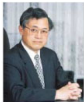
会長 佐々木 毅 (東京大学長)

平成16年4月1日、国立大学法人の発足と時を同じくして、その連合組織である社団法人国立大学協会が活動を開始いたしました。