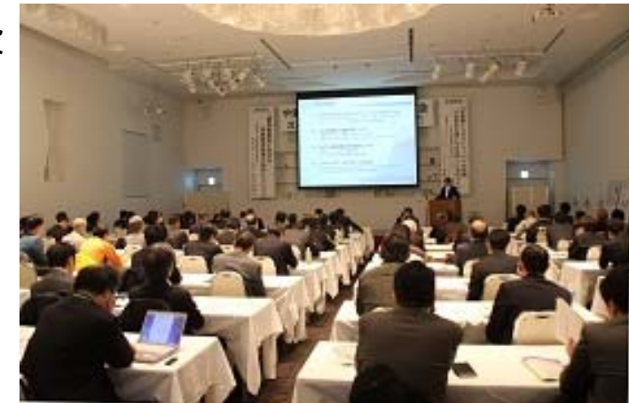
スタートアップセミナー会場の様子