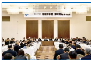
第2回通常総会を開催 (北海道旭川市)