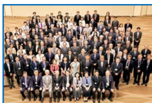
日台交流事業「2025 Taiwan-Japan University Presidents' Forum」