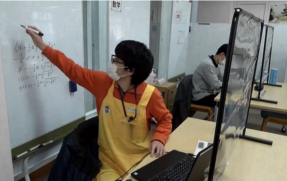
オンラインでの学習相談対応の様子

一方で、8学部中4学部の学生は2年生に進級の際、他地区キャンパスに移るため、当該学部の学生は学部内での対面支援が困難な状況になる。オンライン支援体制が整ったことで、1年生に対してより専門に沿った支援が可能となった。まずは、1年生が在籍する松本キャンパスと農学部がある伊那キャンパスをつなぎ、1年生の専門科目受講支援を開始した。今後、各キャンパスへの拡大を検討する予定である。