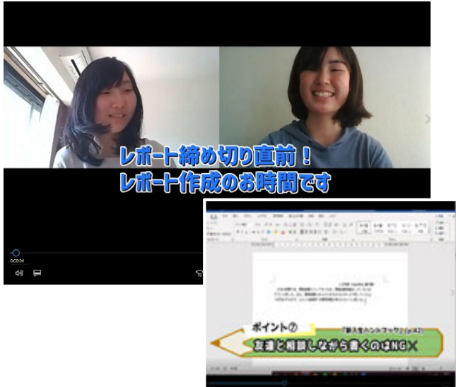
ビデオコンテンツ「レポートの書き方講座」の一場面