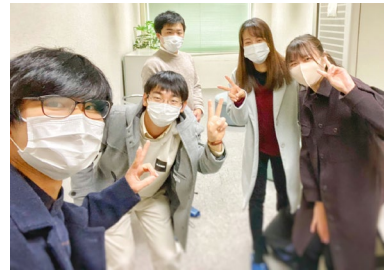
少しずつ集まることができるよう環境になってきました