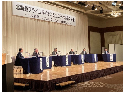
キックオフイベントでパネルディスカッションを実施。 自治体・企業の課題・取り組みを共有

今後は、このイベントの内容を踏まえ、農業、水産業、林業に係る実証を、広大な北海道のフィールドを活用して実施していきます。