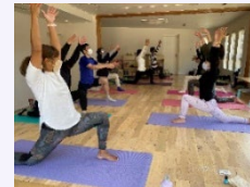
テストツアーの様子(乗馬体験、ヨガ体験)