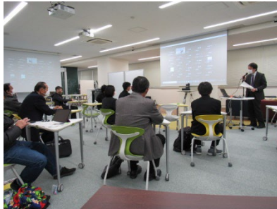
新たに開講した講座の様子