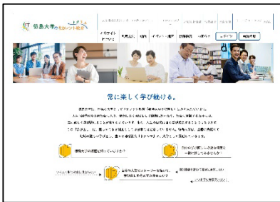
徳島大学リカレント教育ポータルサイト(トクリカ)