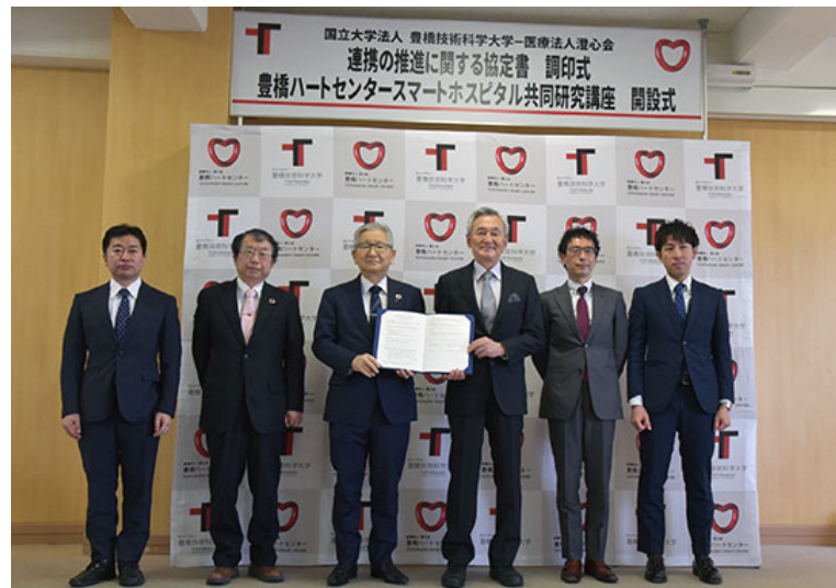
スマートホスピタル共同研究講座開設式

愛知県からも支援を受け、医学部と工学部共同の先端基礎研究から、事業化パートナー企業と協働した社会実装・事業化までを行う総合的なプロジェクトです。