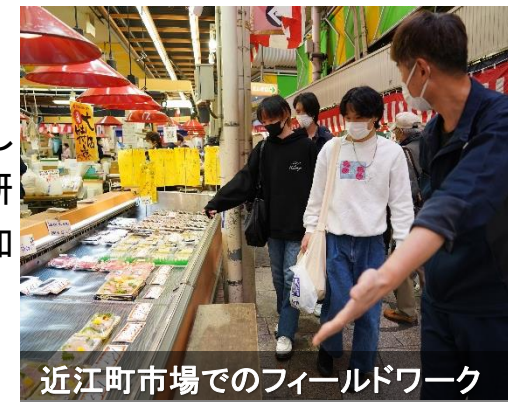
近江町市場でのフィールドワーク