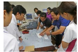
特定行為研修の様子