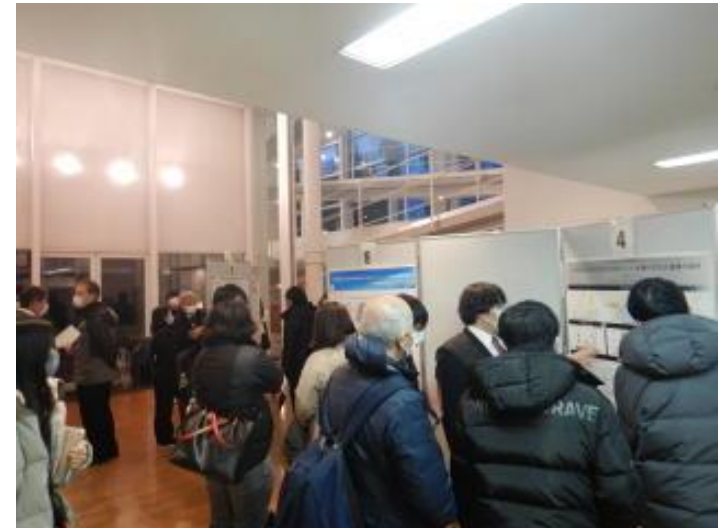
異分野交流イベント「山大研究者トーク」