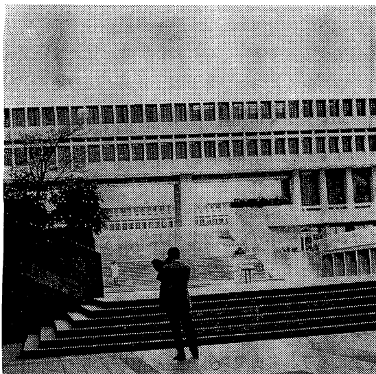
Academic Quadrangle (サイモン・フレーザー大学)

たしかに日本の大学は、近年にいたるまで平穩無事に伝統の上に安眠していた。しかし、世界的に言えば、いわゆる両大戦間の時期に大学の危機が指摘され、大学の顛落が論ぜられていた。当時ジュネーブに本拠をもつWFC S——世界基督教学生連盟——は、大学の危機問題について調査し、かつ、大学改革への提案を行った。その時期には、まだ日本の大学では何の危機感も抱いていなかった。し